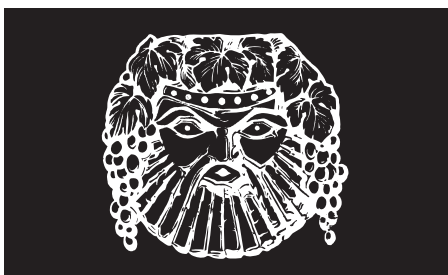
Tête de Bacchus : Banquet du Proconsul, Hôtel Ruhl, Nice, 27 janvier 1924