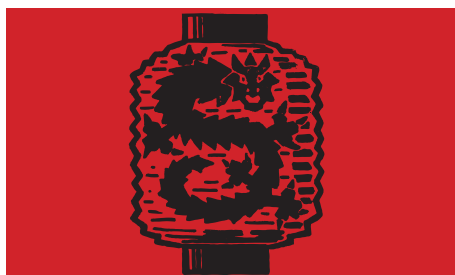
Lanterne au dragon : Fête des Lanternes, Hôtel Ruhl, Nice, 19 mars 1924

Pour supporter l'association FÊTES D'ART achetez un ou plusieurs t-shirts d'après les dessins de Paul Tissier et une affiche réalisée avec les plombs d'imprimerie d'origine servant aux affiches des fêtes.